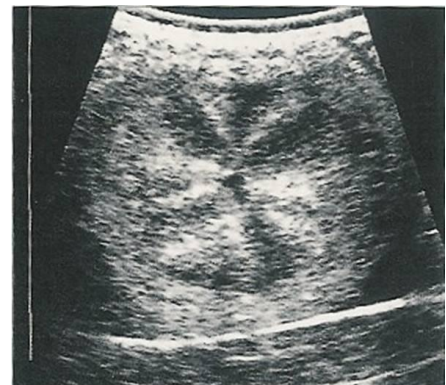
Echobeeld baarmoeder van een hengstige merrie

De dierenarts kan door middel van rectaal onderzoek, met behulp van echo apparatuur het meest ideale tijdstip bepalen voor dekking of inseminatie van uw merrie. Dit gebeurt door de grootte van de follikel (het blaasje op de eierstok waarin de eicel zich bevindt), de mate van hardheid van de follikel, de baarmoeder en de baarmoedermond te bepalen